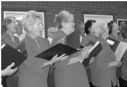
Das Nationalitätengemischtkhor sorgte für den musikalischen Hintergrund